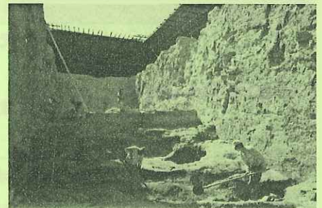
カマン・カレホユック遺跡