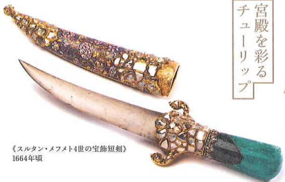
《スルタン・メフメト4世の宝飾短剣》 1664年頃