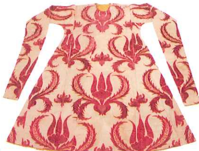
《スルタン・スレイマン1世のものと思われる儀式用カフタン》 16世紀中期

20世紀初頭まで数百年間にわたり栄華を極めたオスマン帝国。その象徴として敬われたのは、「トルコ語で「ラレー」と呼ばれる花、チューリップでした。帝国内で盛んに栽培され、品種改良によって2000種もの多彩な姿を見せたラレーは、文学や美術においても好んで表現されました。 本展では、スルタンの宝物をはじめトプカプ宮殿に残る美術工芸品の中から、ラレー文様があしらわれた品々をご紹介します。オスマンの優美な宮廷文化をご覧いただき。また、オスマン時代に始まるトルコと日本との友好関係の歴史も振り返ります。 約170点の作品を通して、トルコの歴史、文化、美を愛する国民性をより深く理解する機会となれば幸いです。