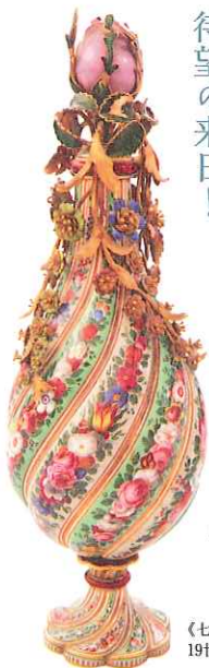
《七宝製バラ水入れ》 19世紀

オスマン帝国の栄華を 今に伝える 至宝約170点。 イスタンブールの トプカプ宮殿博物館から 待望の来日!