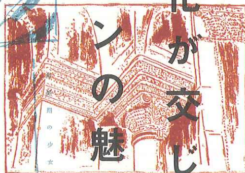
アヤソフィア巨柱の影刻