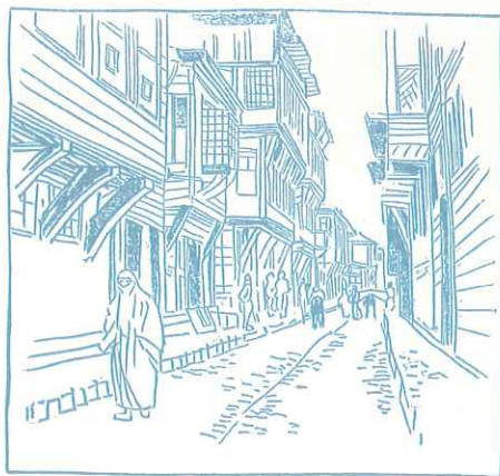
土 耳 古 人 住 宅

美術・建築と庭園・食は、いつの時代も私たちの心を豊かにしてくれます。各分野の第一人者のお話に加え、実際に体験する課外授業も用意いたしました。本年度も山田寅次郎と一緒にオスマン時代へ旅をする気持ちで、みなさまと共に研究を深めたいと思っております。(和多利月子)