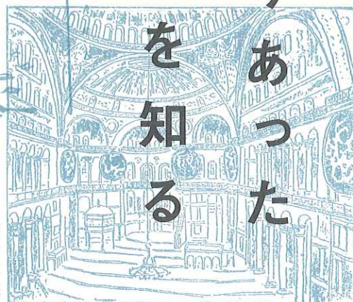
アヤソフィア内部