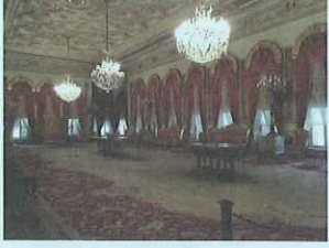
1. スルタンアフメドモスク(ブルーモスク) 2. ボスポラス海峡の明け方 3. トプカプ宮殿博物館・換装の門 4. ユルドゥス宮殿内