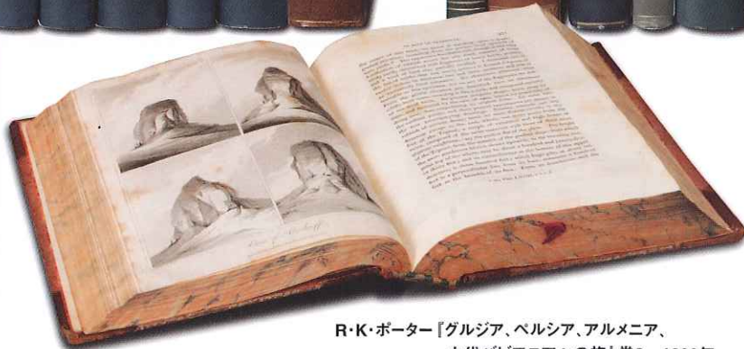
R・K・ポーター「グルジア、ヘルシア、アルメニア、古代バビロニアへの旅」巻2 1822年

休館日 : 月曜日・木曜日 2009年12月24日(木)～2010年1月4日(月) 〈祝・休日は開館、振替休日なし〉 開館時間 : 10:00～17:00 〈入館は16:30まで〉 入館料 : 一般 800円/高大生 500円/65才以上 400円 中学生以下無料/団体15名以上各200円割引 三鷹・武蔵野市民100円 (受付で住所のわかるものをご提示ください)