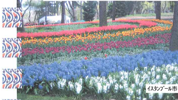
イスタンブール市のチューリップ公園

植付けのデザインはボスポラス海峡とイスタンブール市街の形をデフォルメして、6品種のチューリップを配置し、ロープウェイに